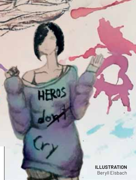
ILLUSTRATION Beryll Eisbach