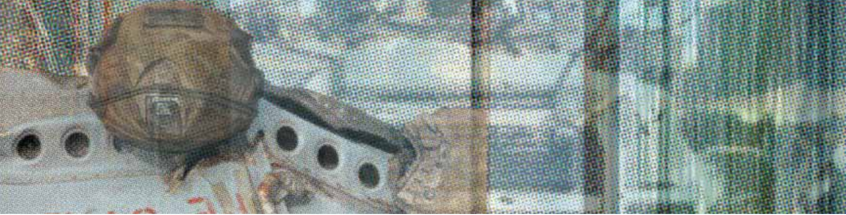
ILLUSTRATION: Anna Veis

dieser ein Doppelleben im Internet führt. Während er ihr gegenüber vorgibt, ein edgy, eher linker Kunststyp zu sein, spinnt er im Netz Verschwörungserzählungen. Sie möchte sich von ihm trennen, genießt aber zunächst ihre geheime Wissens-Überlegenheit und denkt noch darüber nach, wie sie am geschicktesten mit ihm Schluss machen kann. Doch bevor es dazu kommt, ereilt sie die Nachricht vom Tod ihres Noch-Freundes. Nach diesem Schock zieht sie nach Berlin, wo sich die beiden einst kennenlernten. Dort beginnt sie zu daten und nimmt dafür immer neue, von ihr kreierte Figuren an – baut sich also ihre eigenen ‚Fake Accounts‘ auf... nüchtern, cool und manchmal auch witzig lässt Oyler die Ich-Erzählerin sprechen. Immer mal wieder wendet sich diese an die Leser:in oder wird von einer nicht weiter erörterten Gruppe von Ex-Freunden kommentiert. Die kühle Art des Erzählens schafft eine Distanz zur Protagonistin und reflektiert damit den Ton auf Social Media. Die pointierte, überhebliche Trockenheit ist teilweise anstrengend, insbesondere dann, wenn sonst nicht viel Handlung passiert. Sie verträgt sich aber gut mit den inhaltlichen Fragen nach Identität, Nähe und Distanz, Authentizität und der Lust an Täuschung, die dieses Buch verhandelt. Insgesamt eine gute Aufnahme einer von Digitalität geprägten Realität. ◀ Laura Steinl