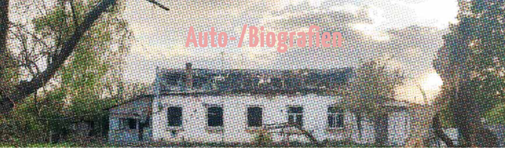
ILLUSTRATION: Anna Veis